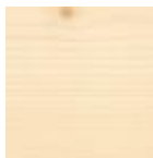
3240 Белое прозрачное